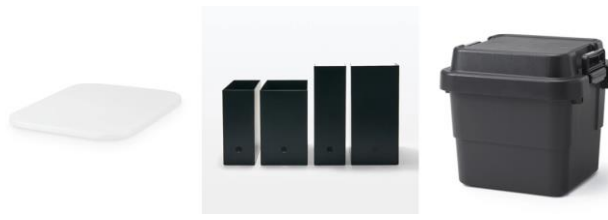
<再生ポリプロピレン入り商品 ※4 >