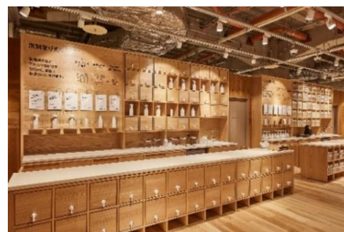
(洗剤量り売りイメージ画像)

必要なものを必要な分だけ購入できる洗剤やシャンプーなどのヘアケア製品の量り売りやナッツ・ドライフルーツ、穀類の量り売りを行います。この取り組みは、プラスチック容器の削減にもつながります。また、店舗屋上にコンポストを設置し、MUJI Kitchen から発生する生ごみをたい肥化し、店頭で取り扱う野菜や果物を生産する農家の皆さまに活用いただき資源循環できるよう仕組化を進めます。